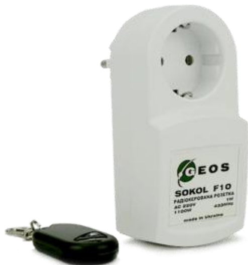
Рис. 1. Внешний вид

Радиоуправляемая розетка SOKOL F30 – предназначена для дистанционного управления питанием нагрузки. Прибор обеспечивает устойчивую передачу сигнала на расстояние до 50м. Устройство не требует дополнительного источника питания, питается от сети 220В. Розетка способна коммутировать питание нагрузки до 3кВт. Устройство простое в настройке и эксплуатации. Прибор имеет светодиод для индикации работы и настройки, а также кнопку управления. В комплекте поставляется брелок для управления питанием нагрузки. Брелок питается от батарейки 12В. Прибор может использоваться для управления освещением, подъемниками ворот, нагревательными устройствами, телевизорами, холодильниками, компьютерами, зарядными устройствами и т.д.