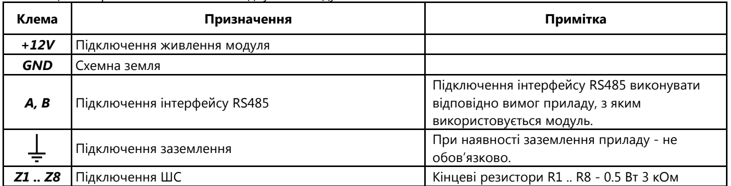
Таблиця 2 – Призначення клемних з'єднувачів модуля

Кожен модуль має унікальний дев'ятизначний серійний номер. Цей номер використовується для приписування модуля до ППК. Серійний номер модуля зазначений на його друкованій платі та продубльований на корпусі модуля і в даному паспорті.