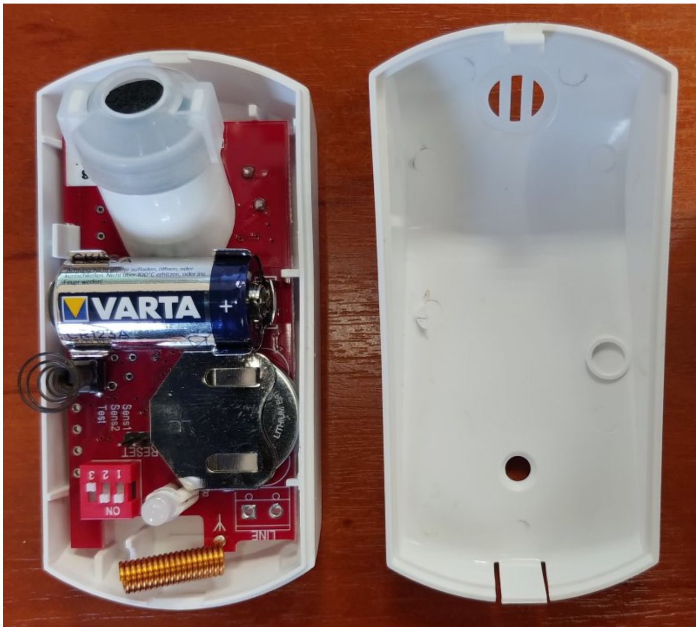
Рисунок 1. Извещатель с открытой крышкой

На плате извещателя также расположен переключатель чувствительности, кнопка тампера вскрытия корпуса, многоцветный светодиодный индикатор, чувствительный преобразователь акустического сигнала и контакты RESET для инициации процесса связывания с радиоприемником «Lun-R».