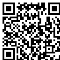
Настанова щодо встановлення