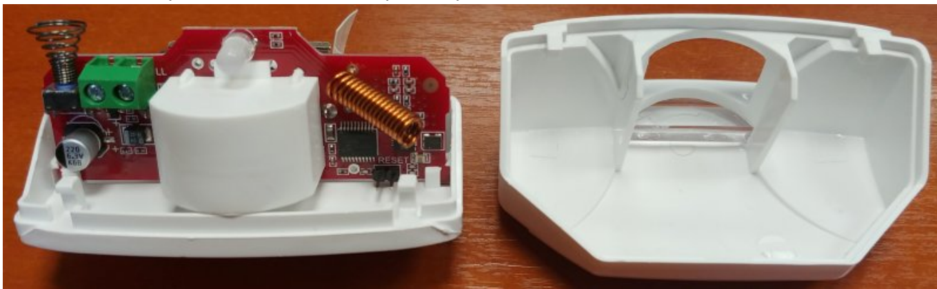
Рисунок 1. Извещатель с открытой крышкой

Извещатель выполнен в пластиковом корпусе со съемной крышкой (рисунок 1). В корпусе установлена плата с антенной; линзой, формирующей зону обнаружения типа «штора»; держателем для установки источника питания; кнопкой тампера вскрытия корпуса; клеммами для внешнего контактного датчика; многоцветным светодиодным индикатором; контактами RESET для инициации процесса связывания с радиоприемником «Lun-R».